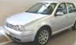
VOLKSWAGEN GOLF 1.6 SPIRIT 105 MANUAL 2003 - 25.308 KM 4.700 eu

LETAMENDI T. 934 538 800 www.letamendi.com