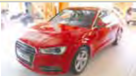
AUDI A3 SPORTBACK 2.0 TDI 150CV AMBITION 2013 - KM 0 32.900 eu

Badal81 CITROEN ESPAÑA BADAL T. 932 274 669 - www.citroenbadal.citroen.es