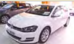
VOLKSWAGEN GOLF 1.6 TDI 105CV ADVANCE 2013 - KM 0 21.300 eu