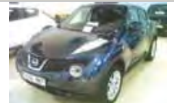
NISSAN JUKE 1.5 DCI 110CV TEKNA PREMIUM, DIÉSEL, MANUAL 2012 - 4.100 KM 17.900 eu