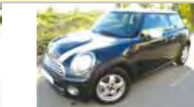
MINI COOPER D DIÉSEL 2007 - 83.845 KM 10.900 eu