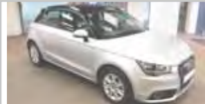
AUDI A1 SPORTBACK 1.2 TFSI 86CV ATTRACTION KM 0 17.400 eu

MAVISA TERRASSA Avda.Can Jofresa, 35 08223 Terrassa T. 937 360 000 (Sr.Enrique)- www.vallescar.es