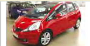
HONDA JAZZ 1.4 IVTEC LUXURY I-SHIFT GASOLINA, AUTOMÁTICO 2009 - 19.000 KM 10.900 eu

NOU MOTOR T. 938 723 332 www.noumotor.com