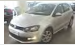
VOLKSWAGEN POLO 1.2 70CV ADVANCE 5P GASOLINA, MANUAL, GRIS / PLATA 2011 - 19.971 KM 8.490 eu

COMPRA / VENDA Si ets professional ANUNCIA'T 932 801 500