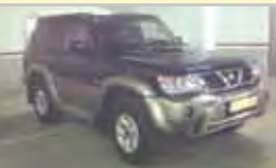
NISSAN PATROL 3.0 GR, DIÉSEL MANUAL, TODO TERRENO 2000 - 75.000 KM 11.500 eu