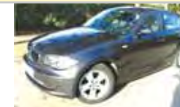
BMW 116 i - 5 PUERTAS GASOLINA 2012 - 86.315 KM 10.900 eu

EUTRASA T. 617 374 811 - www.eutrasa.com