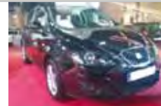
SEAT ALTEA 1.6 TDI 105 CV STYLE DIÉSEL, MANUAL 2010 - 35.000 KM 12.900 eu