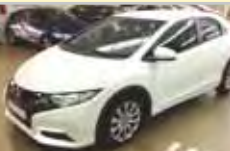
HONDA CIVIC 1.8 IVTEC SPORT GASOLINA, MANUAL 2012 - 11.000 KM 15.900 eu