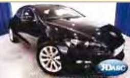
VOLKSWAGEN SCIROCCO 1.4 TSI 122CV GASOLINA, MANUAL 2011 - 39.000 KM 13.140 eu