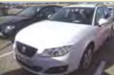
SEAT EXEO ST TDI, 120CV, STYLE FULL EQUIP 2011 - 60.000 KM 13.880 eu