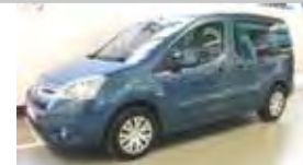
CITROEN - BERLINGO COM. 1.6 HDI 90 SXMULT, MANUAL 2011 - 39.298 KM 11.900 eu