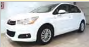
CITROËN C4 HDI90 BUSSINES DIÉSEL, MANUAL 2012 - 11.000 KM 12.900 eu

TALLERES TODODIESEL T. 932 213 080 ventas@talleres-tododiesel.com