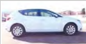
SEAT LEON 1.4 TSI 122CV STYLE GASOLINA, MANUAL 2013 - KM 0 16.900 eu

MOTOR LLANSÀ C/Sangoneres, 4 (Frente a IKEA) L'Hosp. Llob. T. 93 259 14 79 - ventas18@motorllansa.es