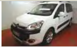
CITROEN BERLINGO HDI 90 XTR PLUS DIÉSEL, MANUAL 2012 - KM 0 16.200 eu