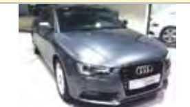
AUDI A5 COUPE 2.0 TDI 177CV DIÉSEL, MANUAL, COUPÉ 2011 - 55 KM 34.900 eu