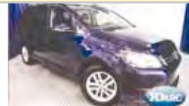
VOLKSWAGEN TOURAN 1.6 TDI 105CV DIÉSEL, AUTOMÁTICO 2011 - 32.000 KM 15.600 eu

MOTORSOL IMPORT C/ Manso, 9 - Barcelona T. 933 250 800-669 718 629 www.motorsolimport.es