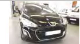
PEUGEOT 308 SW E-HDI ACTIVE FAP BLUE LION, 1.560CC, DIÉSEL 2011 - 38.535 KM 14.700 eu