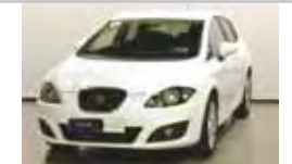
SEAT LEÓN 2.0 TDI 140CV SPORT DIÉSEL, MANUAL 2009 - 63.328 KM 10.900 eu

AUTO BUIGAS T. 93 652 02 03 www.bmwpremiumselection.es/autobuigas