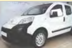
CITROËN NEMO HDI75 ATTRACTION DIÉSEL, MANUAL, FURGONETA 2012 - 14.000 KM 9.900 eu