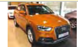
AUDI Q3 2.0 TDI 143CV AMBITION DIÉSEL, MANUAL 2012 - KM 0 35.500 eu

EXCLUSIVAS PONT Sucursal de Sabadell - www.gcondal.com T. 937 161 866 - Ctra. Prats 77 - Sabadell