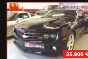
FORD MUSTANG SHELBY GT 500 550 CV, 2011, 25.000 KM EN STOCK