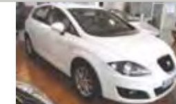
SEAT LEON STYLE 1.9 TDI ECOMOTIVE DIÉSEL, MANUAL 2009 - 69.925 KM 11.900 eu

GRUP LESSEPS T. 932 857 575 www.gruplesseps.com