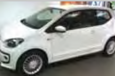
VOLKSWAGEN HIGH UP! 1.0 60CV 3P BLANCO CANDY 2012 - 13.200 KM 9.300 eu