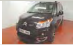
CITROEN C3 PICASSO HDI110 EXCLUSIVE DIÉSEL, MANUAL 2012 - KM 0 16.200 eu