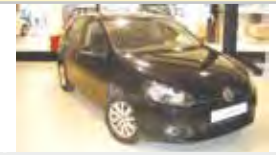
GOLF 1.4 TSI ADVANCE 122CV 5P GASOLINA, MANUAL, NEGRO 2011 - 30.910 KM 12.990 eu