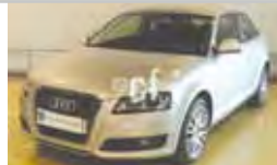
AUDI A3 2.0 TDI 140CV S TRONIC DPF ATTRACTION, DIÉSEL, AUTOMÁTICO 2009 - 46.000 KM 16.900 eu