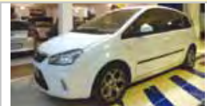
FORD CMAX 1.6 TDCI, 90CV, TREND PACK FULL EQUIP 2009 - 84.000 KM 8.800 eu

AUTOMOVILES GRUPO 3DARC T. 93 274 46 26 - www.tresdarc.com