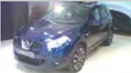
NISSAN QASHQAI 1.6G S&S TEKNA SPORT GASOLINA, MANUAL, FAMILIAR 2012 - 11.500 KM 19.900 eu

MOTORSOL AUTOCASIÓ T. 933239540 www.motorsol.es