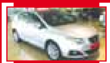
IBIZA 1.6 TDI CR 105CV DPF Style 11.700 €