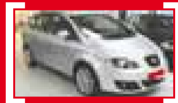
ALTEA XL 1.4 TSI 125CV Style 10.900 €

ESPECIALMENT SELECCIONATS. SEAT SEMINOU I GERÈNCIA.