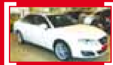
EXEO 2.0 TDI CR 120CV Reference 18.500 €