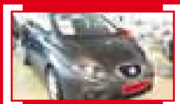
ALTEA FREETRACK 1.6 TDI CR 105CV 2WD Family Bluetooth 18.500 €