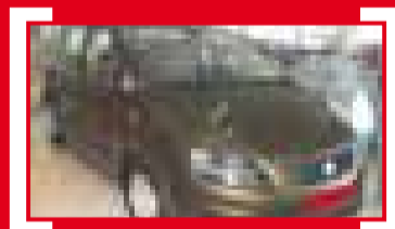
ALHAMBRA 2.0 TDI CR 170CV DSG Ecomotive Style 7p 34.500 €