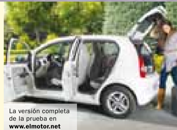
La versión completa de la prueba en www.elmotor.net