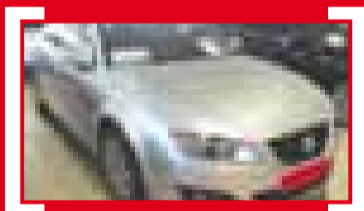
EXEO 2.0 TDI CR 120CV DPF Style + ZL1 14.900 €