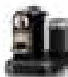
Máquina de Café Automática