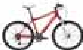
Bicicleta de montaña