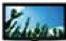
TV 32" (81,28 cm)