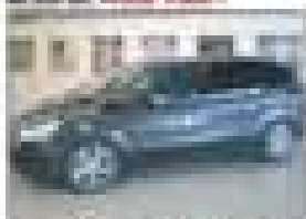
SEAT Ibiza 1.4i 16V 105CV