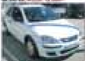
SEAT Ibiza 1.4i 16V 105CV