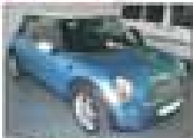
SEAT Ibiza 1.4i 16V 105CV