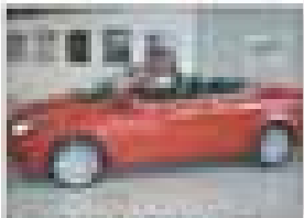
SEAT Ibiza 1.4i 16V 105CV