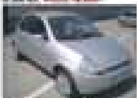
SEAT Ibiza 1.4i 16V 105CV