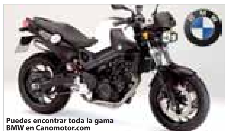
Puedes encontrar toda la gama BMW en Canomotor.com

Consumo: a 90 Km/h de 3,6 l / a 120 Km/h de 4,8 l Combustible: Sin plomo Bastidor: Aluminio con motor autoportante Suspensión del.: Horquilla telescópica Suspensión tra.: Basculantes de doble brazo amortiguador central. Ruedas: Llantas de fundición de aluminio Neumáticos del.: 120/70 ZR 17 Neumáticos tra.: 180/55 ZR 17 Frenos del.: 2 discos flotantes de 320 mm con pinzas de 4 émbolos Frenos tra.: Monodisco de 265 mm con pinzas de 1 émbolo Peso con depósito lleno: 194 Kg Capacidad del depósito: 16 l